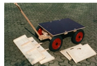
▲ Modell DKZ 30/90 SV mit Rad Nr.3, teilzerlegt als Tieflader. Unlackiert.

Auf besonderen Wunsch können die DKZ-Modelle auch länger, breiter, niedriger und (oder) höher hergestellt werden. Preise für Änderungen auf Anfrage! Mögliches Zubehör: Reserverad, Imp.-Öl, Lack, Sicherheits-Reflektoren, Sitzbank, Sitzkissen, Plane, Kleinteile-Korb, Beschriftung, Werbung. Siehe auch Seiten: 21, 22, 24, 25, 30, 35, 36, 37, 38, 41 und 42.