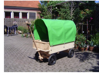
▲ DKZ 30/120 SV mit Bremse, Plane und Kleinteile-Korb, unlackiert.

Alle Bollerwagen ohne Lackierung werden immer sauber geschliffen und lackierfertig ausgeliefert!