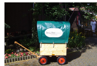
▲ DKZ 60/90 SVL, mit Rad Nr. 3 und Plane, lackiert. Sonderanfertigung: Kasten 60 cm hoch.