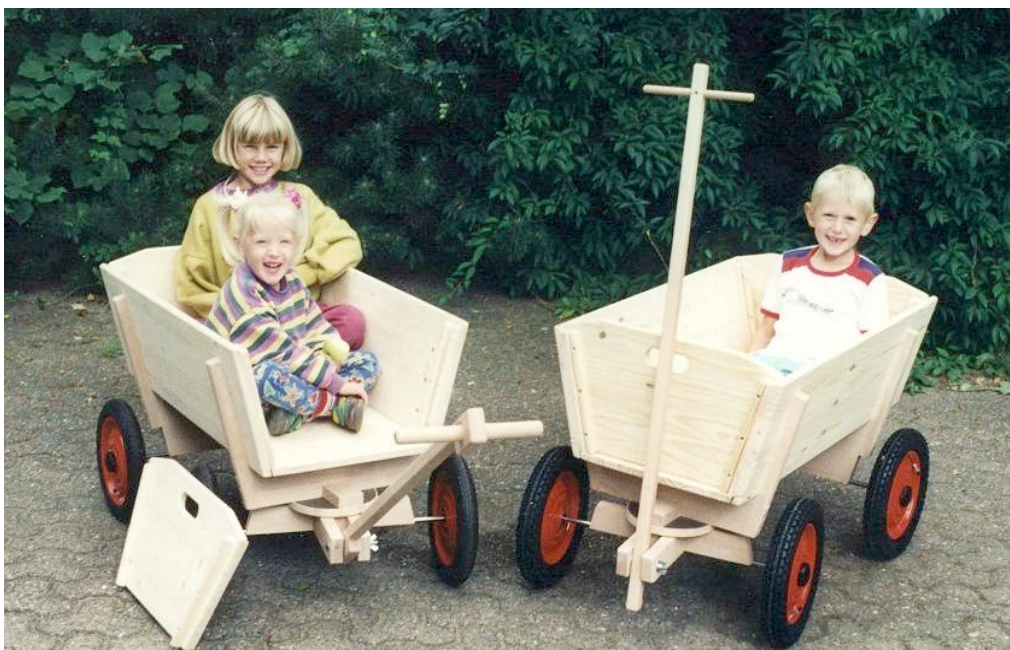
links: Modell G 30/90 H mit Rad # 6 (alt); rechts: Modell G 30/90 H mit Rad # 3, beide ohne Lackierung.

Alle G-Modelle jetzt auch mit Sitzkissen ausstattbar! Siehe Seiten 20a bis 20c.