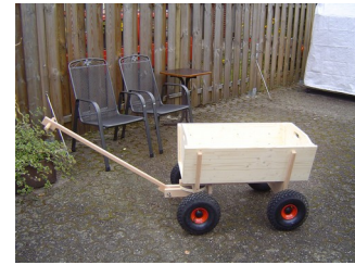
▲ Modell G 25/75 H mit Rad Nr. 9, komplett zusammen gebaut und unlackiert.