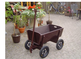
▲ Modell G 30/90 HPBL mit Rad Nr. 4K, mit Lackierung (braun).

ASL – Achsschenkellenkung - Ausführung G.2 ist bei unseren G-Modellen nicht möglich!