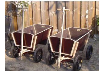
▲ 2 x Modell G 30/90 HPB mit Rad Nr. 4K. Ohne Lackierung.

Großer Drehschemel und Lenkanschlag sowie Unterlenkbarkeit der Räder sind auch hier eine "INTANÄSCHENÄLe" Selbstverständlichkeit, genauso wie die relativ großen Räder. (ab 260 bis 330 mm Durchmesser). Das G-Modell fertigen wir in 2 Größen, die sich in der Länge und in der Höhe unterscheiden. Alle G-Modelle werden mit Edelstahl-Achsen und Edelstahl-Schrauben A2 oder A4 gefertigt! Jetzt alle Bollerwagen der Modelle G mit kugelgelagertem Drehschemel! Räder für 25/75: nur Rad Nr. 2K oder Nr. 9 möglich! 4 neue Typen: 25/75 HPB, 25/75 HPBL, 30/90 HPB und 30/90 HPBL, alle komplett aus kochwasserfestem PlanBoard gebaut, mit Rad Nr. 2K (für 25/75) und 4K (für 30/90). Räder für 30/90 ab Nr. 3 bis Nr. 10PU. Räder siehe auch Seiten 15 bis 51. Bei Bestellung bitte Rad- und Bestell-Nummer angeben. Bei der Höhe, beim Gewicht und bei der Zuladung wurden die Räder Nr. 9 bzw. Nr. 3 berücksichtigt. Mögliches Zubehör: Reserve-Rad, Plane, Abdeckplane, Öl, Lack, Sitzbank, Sitzkissen, Polster, Sicherheits-Reflektoren, Ihre Beschriftung, Werbung. Siehe auch Seiten 15 bis 51.