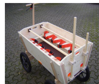
▲ D40 40/120SV mit 8 roten 2Punkt-Gurten und mit einseitigem Druck-Verschluss, mit Bremse.