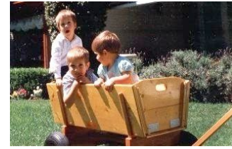
▲ Drei glückliche Jungens mit einem D 30/90 SVL, in Buenos Aires.