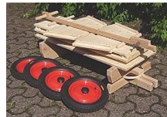
▲ D 30/100 SV mit Rad Nr. 3, in wenigen Sekunden „ohne Werkzeug“ in ein kofferraumgerechtes Paket zerlegt, und genauso schnell wieder ohne Werkzeug zusammengesteckt!